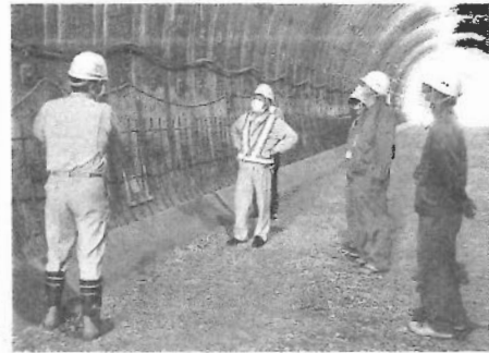
トンネル工事を見学する生徒