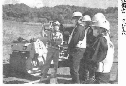
最新のAR技術を活用した施工管理なども紹介

【浦河発】室蘭建設業協会、日胆地区測量設計協会、室蘭開建、室蘭建管の4機関で組織する「日胆地区区からの建設技術者を育てる会」は12日、室蘭工業高校の生徒を対象に現場見学会を開催した。最新のICT建設機械やドローンの操作体験を実施。次代を担う子どもたちに、建設業の魅力や社会資本整備の重要性を伝えた。どうなん建設おしらせ隊は、若手技術者の減少や担い手不足といった課題の解消を目指し、2020年10月に発足。道南地区の4団体が連携して建設産業の魅力を広げ発信し、業界の担い手確保・育成につながる取組を推進している。