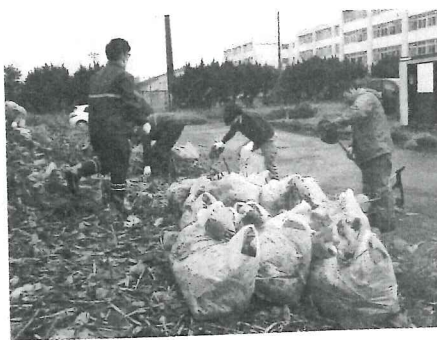
集めた草を袋詰めした